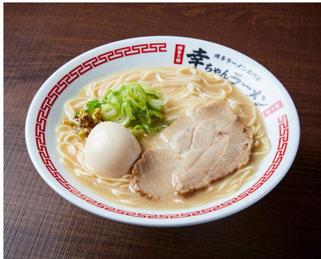
味玉ラーメン1,330円(税込)