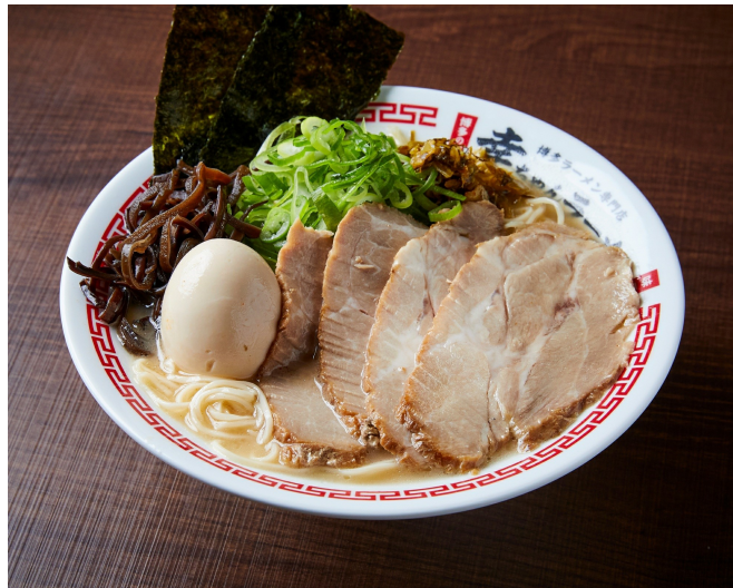
スペシャルラーメン2,330円(税込)