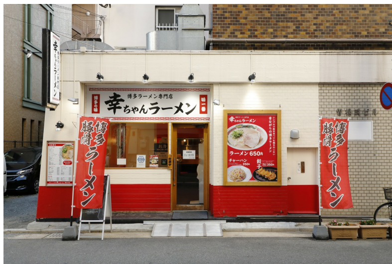
幸ちゃんラーメン1号店 外観

「幸ちゃんラーメン」実店舗一覧： https://www.ikkousha.com/store-produce/